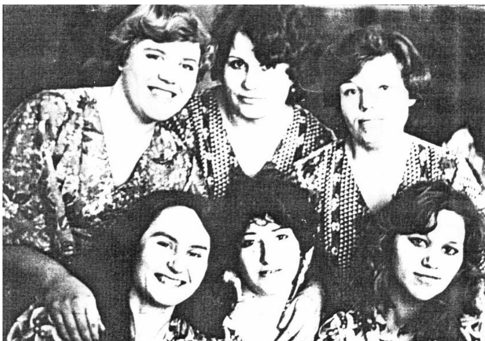
Женский вокальный коллектив.